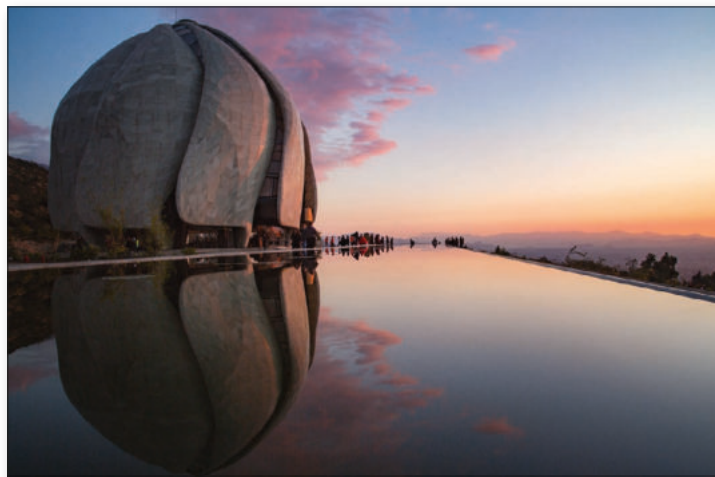
© BAHÁ'Í - La maison d'adoration de Santiago (Chili) au pied de la cordillère des Andes, elle jette d'une vue splendide sur la ville et les montagnes.

Le calendrier court sur 16 mois (de septembre 2023 à décembre 2024). Chaque mois s'articule sur une double page comprenant une grande image légendée ainsi que la mention des principales fêtes des différentes familles religieuses : chrétienne † (catholique, orthodoxe et protestante), juive 🕍, musulmane ☾, hindoue 🌀 et bouddhique 🌀, jaïne 🙏 et sikhe 🌀, chinoise ☯ et shintô 🌀, zoroastrienne 🌀 et baha'ie 🌀 ; sans oublier les traditions ethniques 🌀 et la société civile 🌀.